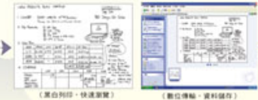
(黑白列印·快速瀏覽) (數位傳輸·資料儲存)