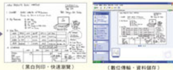
(黑白列印·快速瀏覽) (數位傳輸·資料儲存)