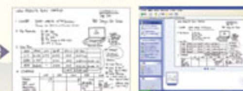
(黑白列印·快速瀏覽) (數位傳輸·資料儲存)