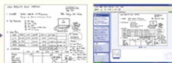
(黑白列印·快速瀏覽) (數位傳輸·資料儲存)